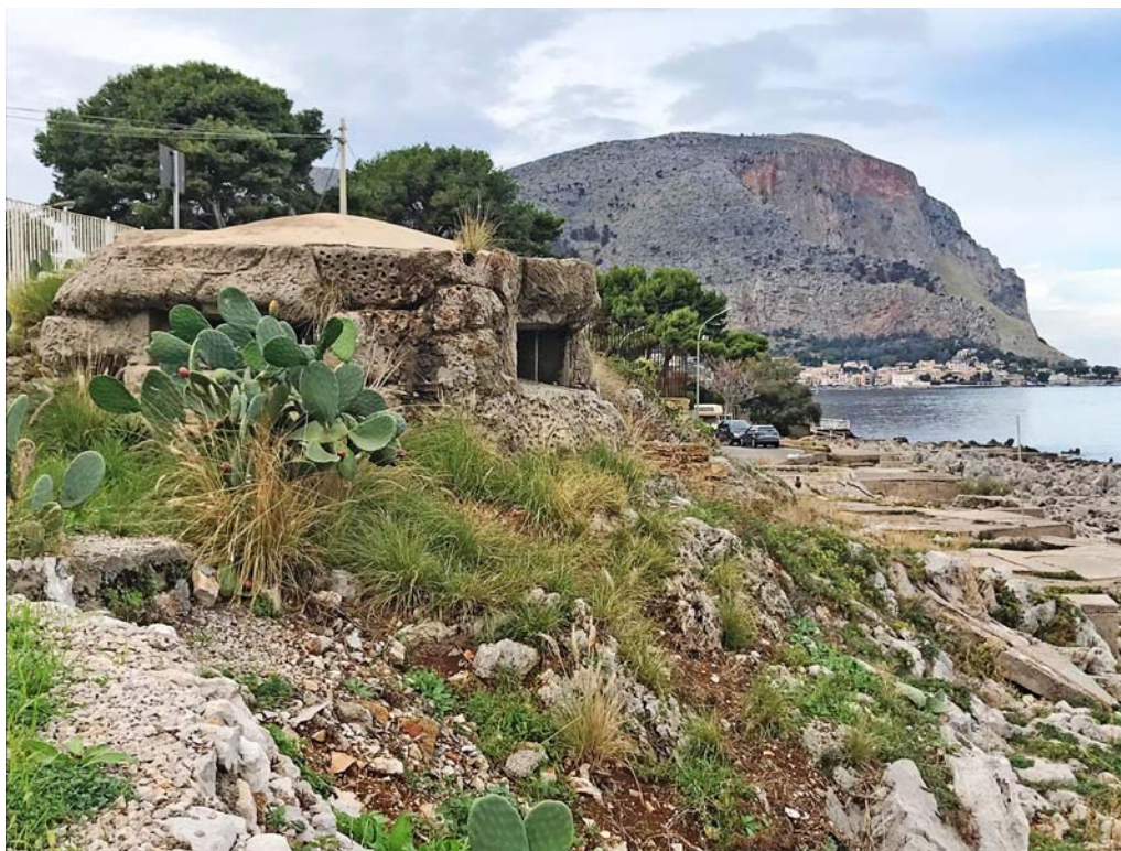
Fig. 3 - Pillbox sul lungomare Cristoforo Colombo, Palermo.