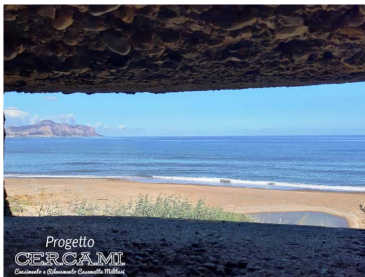
Fig. 8-9-10 - Visuali rivolte verso il paesaggio in provincia di Palermo ©Palermo Pillbox Finders.