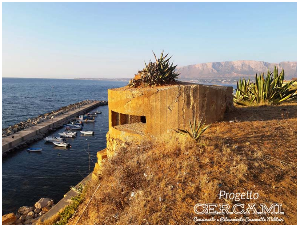
Fig. 4 - Pillbox sulla costa di Balestrate, provincia di Palermo ©Palermo Pillbox Finders.

interessante rispetto al caso studio che si va proponendo, è che l'agopuntura non necessariamente si traduce in opere e in alcuni casi si tratta semplicemente di introdurre attività, comportamenti e condizioni positive per la trasformazione.