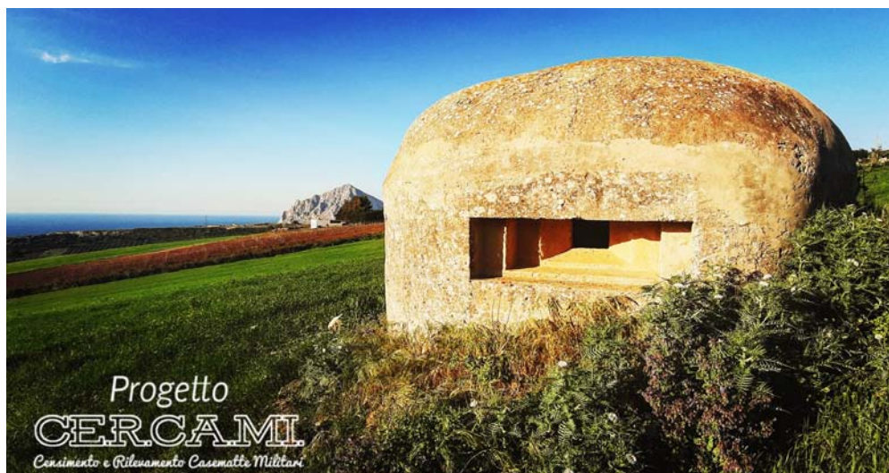
Fig. 5 – Pillbox a Valderice, in provincia di Trapani ©Palermo Pillbox Finders.