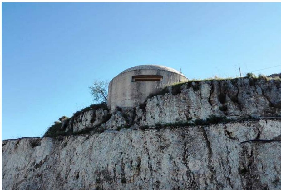
Fig. 6 - Pillbox in provincia di Siracusa

La comunicazione del patrimonio culturale infatti, non è solo la corretta didascalica trasmissione delle informazioni, ma al giorno d'oggi include significativi aspetti legati alla percezione, all'impatto emozionale e alla possibilità da parte dei fruitori di essere parte attiva di una scoperta, data dall'occasione di creare una relazione con le postazioni (e attraverso di esse con il paesaggio) e di vivere un'esperienza in maniera personale. Le architetture della difesa si trasformano quindi in episodi culturali, disseminati nel territorio ma parte di un'unica rete che attraverso riproposizioni scenografiche e un linguaggio contemporaneo vuole restituire un nuovo senso alle cose e