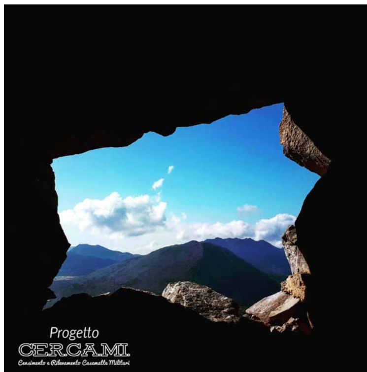
Fig. 7 - Visuale dall'interno di una batteria contraerei verso il paesaggio di Monte Cozzo di Lupo, Palermo

Pertanto, interrogarsi sul significato delle tracce storiche persistenti sul territorio e sul senso che hanno avuto (e che possono ancora avere) porta all'individuazione di tre fasi distinte: "il momento della ricerca, con l'individuazione delle tracce e la costruzione del dato; il momento della tutela, con le procedure che ne favoriscono la conservazione nel tempo; il momento della valorizzazione, attraverso la quale restituiamo un senso, il nostro, alle cose del passato" (Manacorda, 2007).