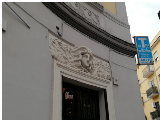
Fig. 3 - Particolare portale del palazzo a corso Chiaiano n. 1

L'estrazione del tufo è avvenuta in tutta la città, anche in pieno centro, e le cave di tufo ipogee de rione Sanità ne sono la testimonianza. Ma verso la corona settentrionale della città vi sono varie cave a cielo aperto: enormi "scatole tufacee", che per la mancanza di efficace azione di recupero, sono diventati i luoghi ideali per ospitare discariche autorizzate e non.