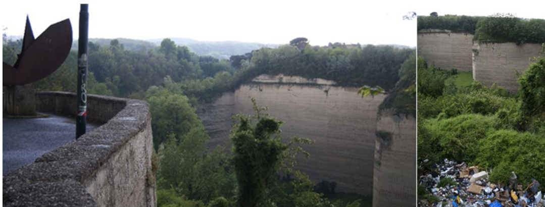
Fig. 5 - Vista dal belvedere di via Comunale Margherita sulla cava, dove si intravede la scultura di Munari ma anche lo sversamento di rifiuti non autorizzati.

L'intervento di Jorit è un'azione che smove le coscienze e dona speranza, ma è solo un punto di partenza, un gesto per avviare un difficile processo di rigenerazione, che dovrebbe valorizzare le opere di quartiere attraverso l'inserimento di varie funzioni, per rendere lo spazio sicuro e per mettere al centro del progetto i cittadini. Come è avvenuto nel Central District di Rotterdam, un quartiere in prossimità della stazione centrale,