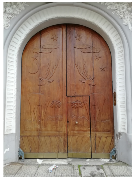
Fig. 4 - Portale di un edificio su via Santa Maria a Cubito

Le cave si perdono nel paesaggio circostante diventando delle aree del quotidiano, come la non lontana grande cavità del Vallone San Rocco sormontata dal viadotto della metropolitana