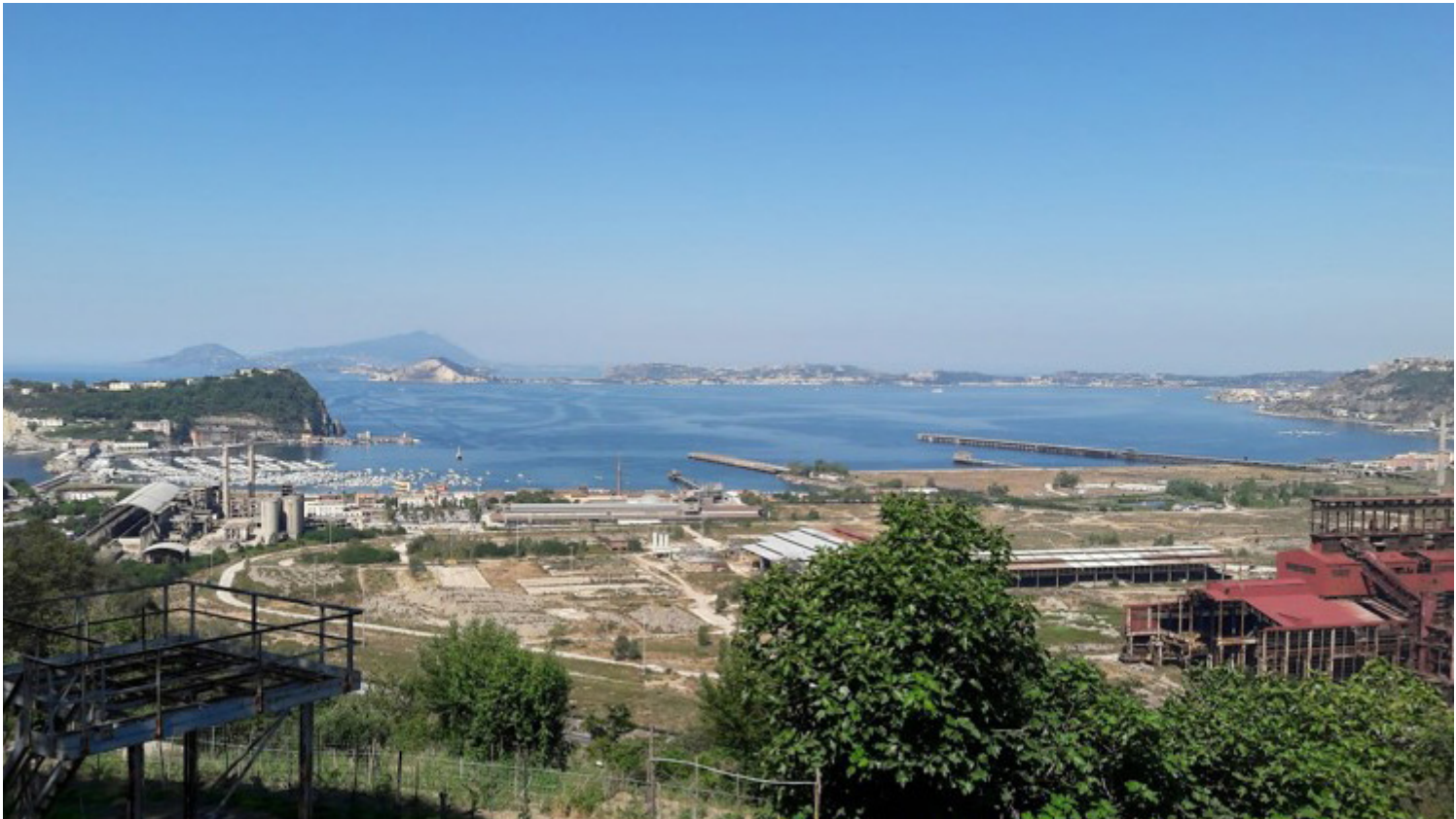
Fig. 2 - Vista di Bagnoli

C'era una volta a Bagnoli ... la natura , con i suoi colori, odori, rumori che segnavano il tempo lungo delle stagioni e quello breve della giornata.