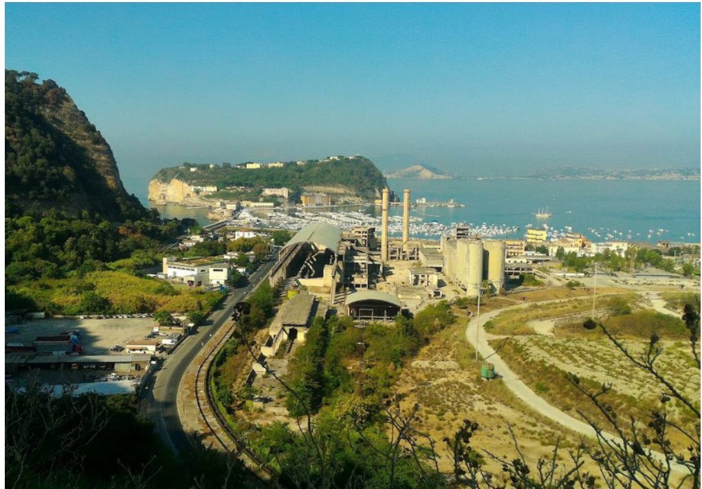
Fig. 4 - Vista di Bagnoli area Ex Cementir

silenzio depressivo della solitudine, che non si riesce certo a colmare con le sporadiche iniziative rilocalizzative intraprese dalla pubblica amministrazione e dalle istituzioni che la fiancheggiano; un silenzio che sopravvive persino ai frastornanti concerti di particolari espressioni dell'arte musicale contemporanea che sembrano particolarmente mirate a dare libero sfogo alle... esuberanze giovanili.