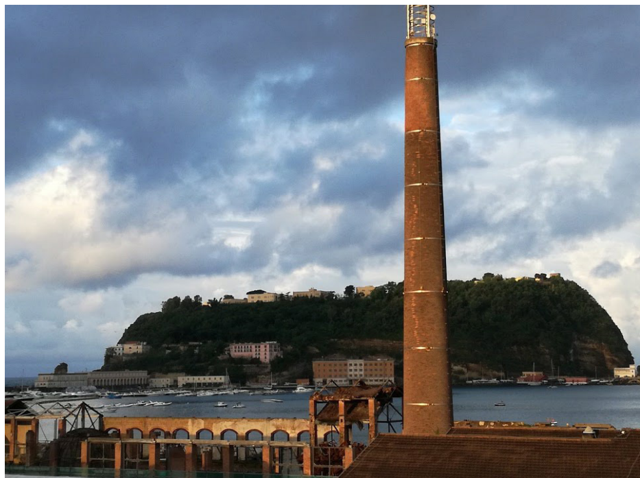
Fig. 1 - Vista dell'isola di Nisida da Bagnoli (immagine tratta da Google Earth)

The last sixteen years of administrative inertia, with many cultural and political debates open to the public, but few proposed - although not finally approved - measures, have generated several contrasting planning ideas and design solutions, characterised by utopian views and individual interests. Such approach has created the preconditions for lack of action by public stakeholders. The deadlock derives from the concern of taking wrong decisions, that is to say the fear of privileging or tolerating speculation.