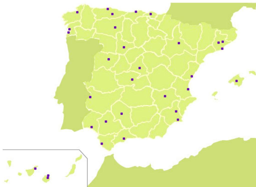
Fig. 1 - Distribución geográfica de los 29 programas URBAN y los dos programas REGIS.

La revisión de los programas, a través de la documentación generada en el marco de