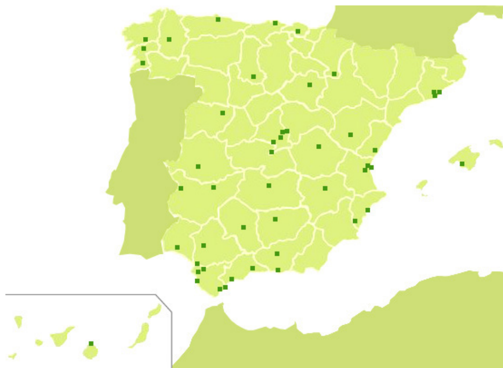
Fig. 4 - Distribución geográfica de las EDUSI aprobadas en ciudades de más de 50.000 habitantes y capitales de provincia 25 .

El desarrollo de estos instrumentos ha permitido a un gran número de ciudades españolas familiarizarse con el “método URBAN” o modelo de regeneración urbana integrada propuesto por la UE. Hasta el momento 96 ciudades españolas de más de 50.000 habitantes o capitales de provincia han desarrollado uno o varios de los instru-