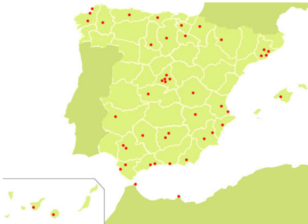
Fig. 3 - Distribución geográfica de los 46 programas de la Iniciativa Urbana.

El estudio de los programas de la Iniciativa Urbana se ha centrado en las propuestas desarrolladas por las ciudades en 2007 y 2008 para acceder a la misma 18 . Esto es debido a que el gran número de programas no ha hecho viable, en el marco de la investigación que se está desarrollando, abordar también los documentos de seguimiento y evaluación de todos ellos. Se ha elegido centrar el análisis en el documento de propuesta de cada programa porque en él se describe la estrategia desarrollada por cada ciudad para