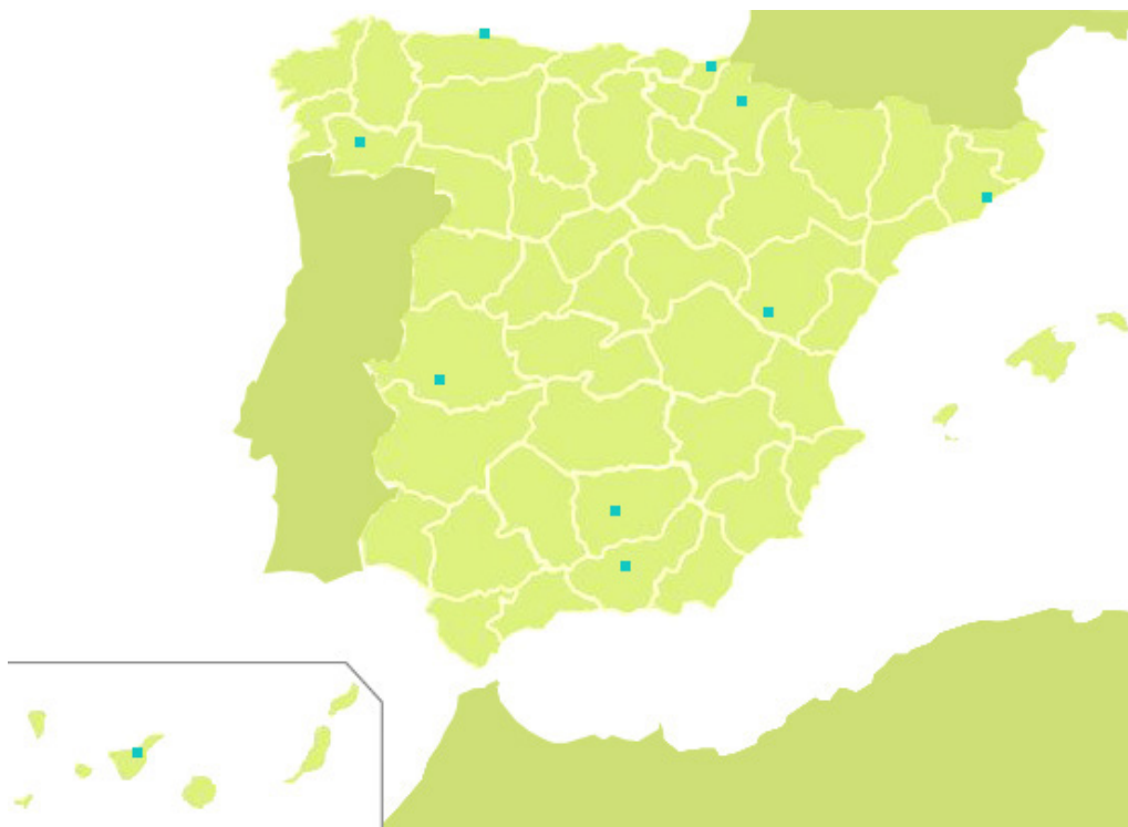
Fig. 2 - Distribución geográfica de los 10 programas URBAN II.

no comunitaria procedió del Estado (que complementó los programas con cantidades que variaron entre los 6.000 y los 15.500 €), los Ayuntamientos y el sector privado (sólo en el caso de Ourense el sector privado aportó unos 430.000 €).