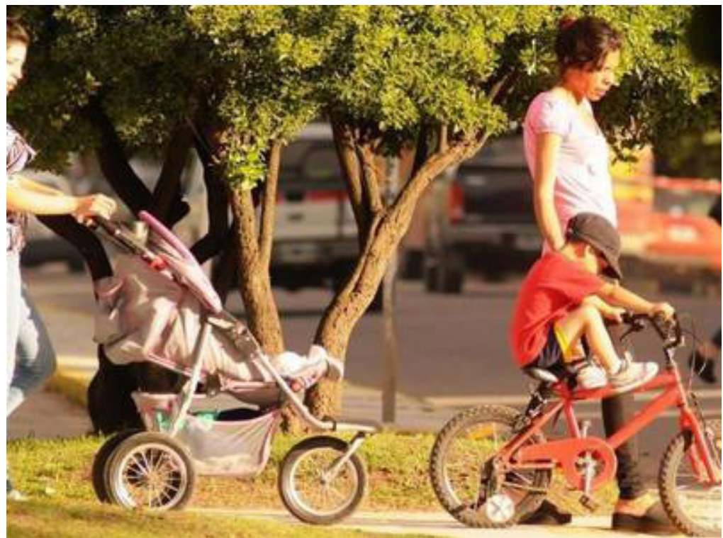
Fig. 6 - Las mujeres recorren la ciudad de una manera diferente a la de los hombres, porque cumplen con el trabajo de cuidados socialmente asignado según sus roles de género.

La Economía Feminista propone “una recuperación de los elementos femeninos ignorados, de las mujeres como agentes económicos y de sus actividades como económicam-