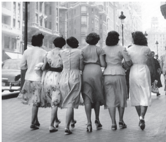
Fig. 1 - Imagen de las Jornadas sobre Género y Producción del espacio. De la exclusión a la reivindicación del derecho a la ciudad, celebradas en Barcelona en noviembre de 2015.

The city of the 21st century is called to be an inheritor of the rationalism and urban development of the 20th century and the perfect daughter that the capitalist logic and the phenomenon of the globalization, which has increased in a great rate in the last decades, have come up with. Among all the social and environmental derivative impacts, in the article below, we will focus on the consequences that the generalization of this hegemonic model of city has had for women. Since the modern project and the social construction of the masculine subject as the universal one, the public and civic coexistence space has been specially designed and organized to satisfy the economic and political interests of men, leaving out the needs of other human groups that have not adjusted to the well versed model.