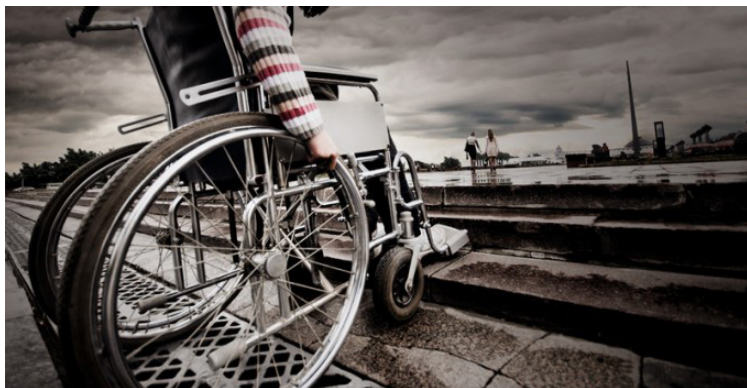
Fig. 3 - las barreras arquitectónicas para personas en sillas de rueda son muy frecuentes en las ciudades.