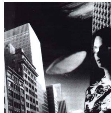
Fig. 2 - La ciudad ciega al género.

De hecho, estas iniciativas urbanísticas comprometidas con otras formas de valorar