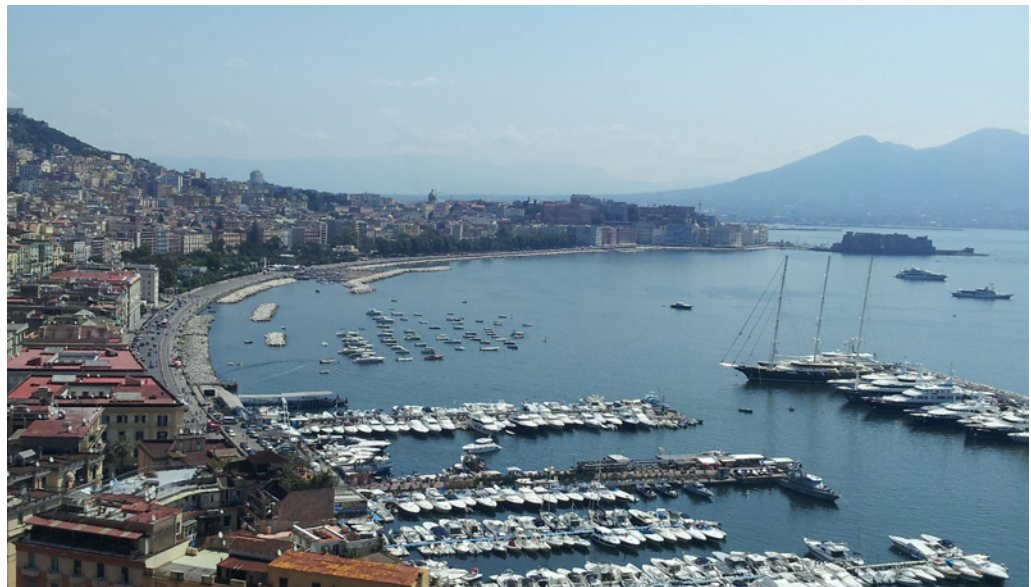
Fig. 1 - Il lungomare di Napoli

The award “La Convivialità Urbana [Urban Conviviality]” is promoted in order to support a participated architecture characterized by a project approach and methodology that comprehend not only urban aspects of the place, but also economic and social, cutting down multidisciplinary walls, contaminating knowledge and creating new models of sharing and cooperation for a sustainable urban requalification process. Focus of this presenting paper is the interpretation of the experience of the award “Urban Conviviality” as opportunity to reflect on best practice and approaches of civic activation; even if necessarily distinguished by the prescribed initiatives in the field of participation search shows that this shift goes hand-in-hand with a review of the integration policies