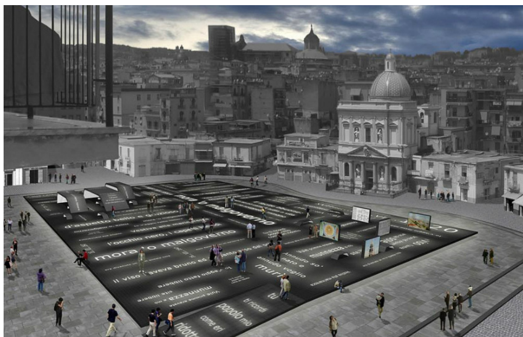
Fig. 3 - Progetto vincitore III edizione

Coerentemente con gli obiettivi di una progettazione partecipata, l'Associazione Napolicreativa ha esplicitamente invitato i partecipanti in gara, a scendere in campo e intervistare i vari soggetti che a campione testimoniassero un sentire collettivo rispetto a determinate questioni e consentissero di esplicitare esigenze di fruizione degli spazi pubblici selezionati dal Premio. Già in occasione delle precedenti edizioni, l'attivazione di tale processo partecipativo ha condotto alla sperimentazione di esperienze innovative come il progetto "Piazza Mercato Network" (Trillo et al., 2013), nato in occasione della III edizione.