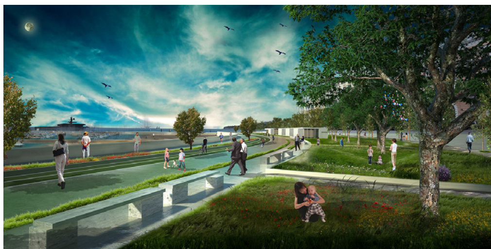
Fig. 5 - Progetto “#1778” classificato al 1° posto della V edizione

Il nome del terzo progetto vincitore “Lungomare in_vita” (fig. 7) nasce dall'esigenza del gruppo di progettisti di rendere il lungomare organicamente vitale al pari delle altre città europee, quali ad esempio Barcellona e Lisbona. Napoli con le sue peculiarità storico-culturali e paesaggistiche non può essere da meno, e per giungere a questo risultato, il gruppo si pone l'obiettivo di “eliminare per valorizzare”, cancellare il superfluo, ciò che risulta essere elemento invasivo. La strategia proposta si fonda su scelte progettuali quali quella di liberare la Villa Comunale dalla recinzione e ricostituirne l'antico decoro attraverso le sue attività storiche, trasferire lungo la Riviera di Chiaia il traffico veicolare, riunire il tessuto urbano al lungomare, eliminare le scogliere a ridosso del muro