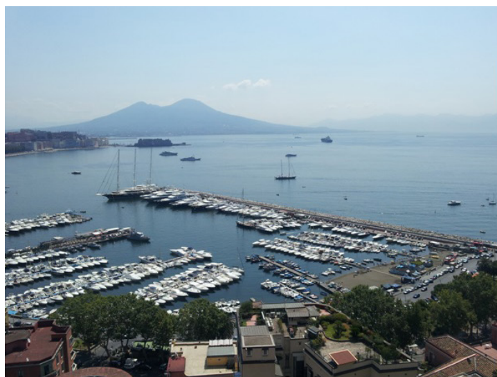
Fig. 2 - Mergellina e il porto di Napoli

Tra i programmi di rilancio urbano all'interno del Programma Integrazione Urbana PIU-Europa per la trasformazione fisica del lungomare e del centro storico di Napoli, dichiarati dall'UNESCO patrimonio dell'umanità, occorre ricordare la tratta di Mergellina della Linea Metropolitana 6 che ha l'obiettivo principale di garantire la fruizione panoramica del waterfront, con un'ampia terrazza a mare. (Amirante, 2001). La strategia di progetto è risultata tuttavia inefficace, in quanto problemi, derivanti in parte dalle trasformazioni fisiche indotte dall'apertura e gestione dei cantieri ed in parte dal complesso sistema delle acque, hanno determinato forti ritardi nella realizzazione dell'opera, aggravati dal crollo del Palazzo Guevara della Riviera di Chiaia.