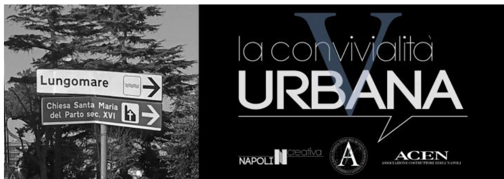
Fig. 4 - Immagine concorso V edizione