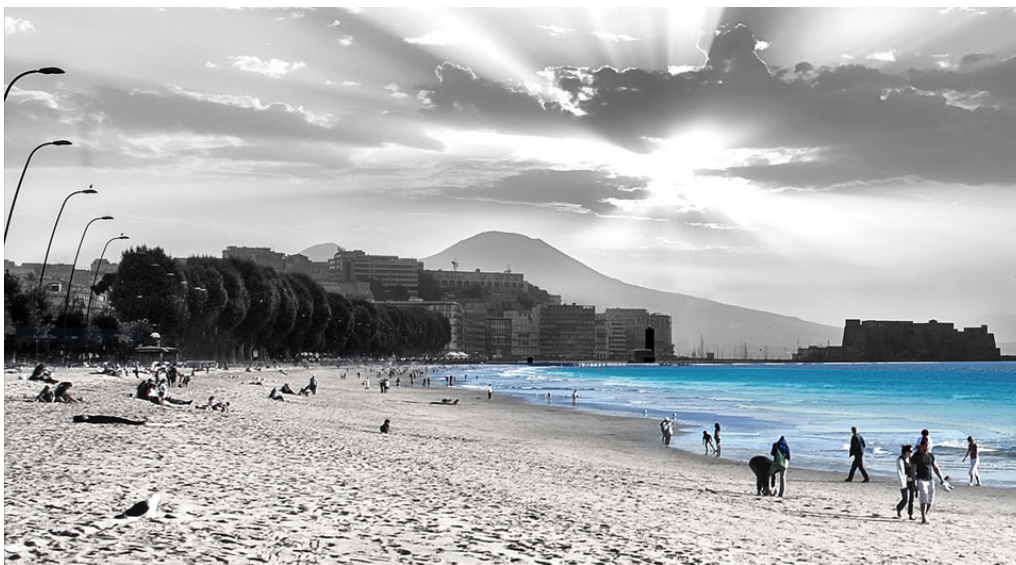
Fig. 6 - Progetto "La città liberata" classificata al 2° posto della V edizione

«La metropoli degli umani prende vita attraverso l'energia creativa dei suoi abitanti» è il punto di partenza del progetto del secondo classificato, "La città liberata" (fig. 6), che nasce dall'idea di restituire ai cittadini napoletani il proprio lungomare ridonando loro l'arenile perduto nel tempo. Il lungomare viene reso abitabile, con un computer ogni 5 mq, grazie ad una rete cablata che scorre lungo tutto il sottosuolo della spiaggia. Una città liberata è intesa nel senso che viene epurata del suo ruolo di metropoli-mercato in cui si perde la distinzione tra luoghi e funzioni, ma acquisisce un nuovo volto che partendo dalla cosiddetta città cablata (Beguinot, 2008) possa unire tecnologia e natura in una nuova identità urbana in continua trasformazione.