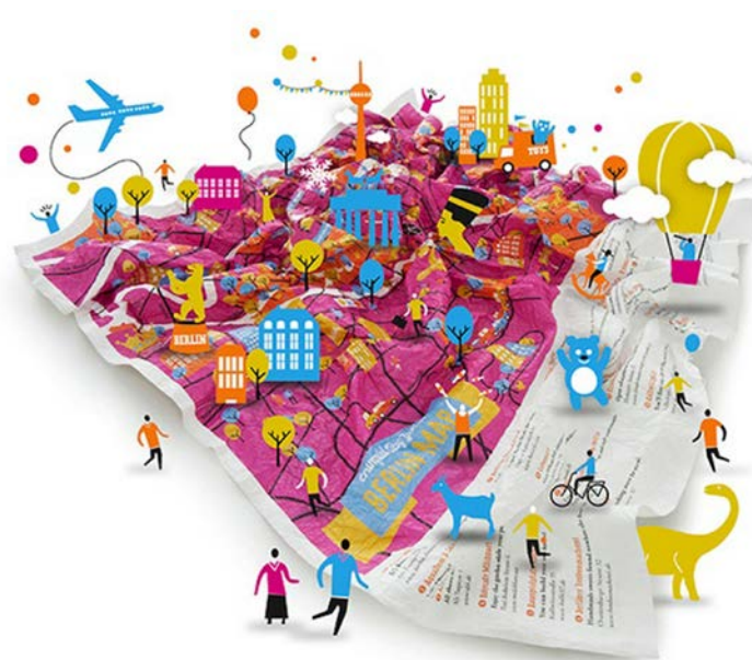
Fig. 1 - Crumpled City. Immagine pubblicitaria che rappresenta la molteplicità urbana odier- na.

The coastal mediterranean areas, for their stratification and complexity of human and