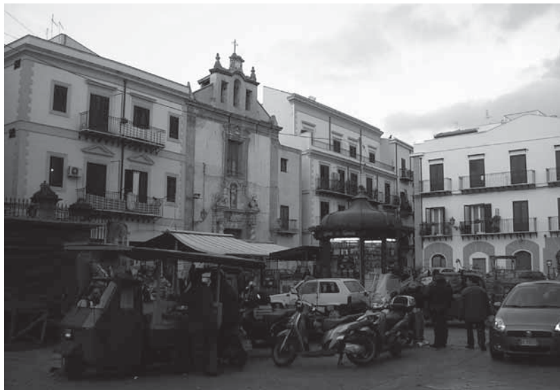
Palermo, piazza del Carmine

città; percorrendo questi itinerari i tracciati preferenziali che storicamente hanno determinato la configurazione di quella città (T. Colletta, 2002)