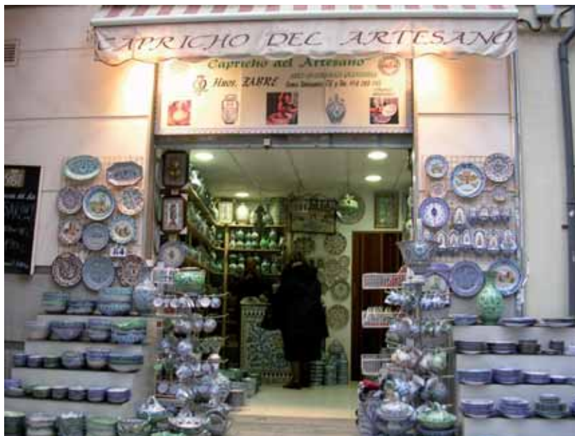
Granada, negozio di ceramiche

quale dimensione dell'habitat mediterraneo in piccoli spazi, costruito e vissuto dalle popolazioni, scongiurando il pericolo del cambiamento, nella costante spinta del "rinnovo".