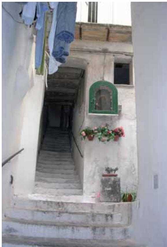
Amalfi, vicolo e altarino

Questa nota presenta i risultati di un lavoro di ricerca e di esperienze dirette svolte nel corso degli anni sulla storia delle città del Mediterraneo e dei loro valori del patrimonio urbano. Studi nei quali ho potuto constatare la specificità unica di molte città mediterranee, e anche i caratteri invariati presenti in esse, sia materiali che immateriali, da formare una riconoscibilità e un comune spirito del luogo o genius loci 1 .