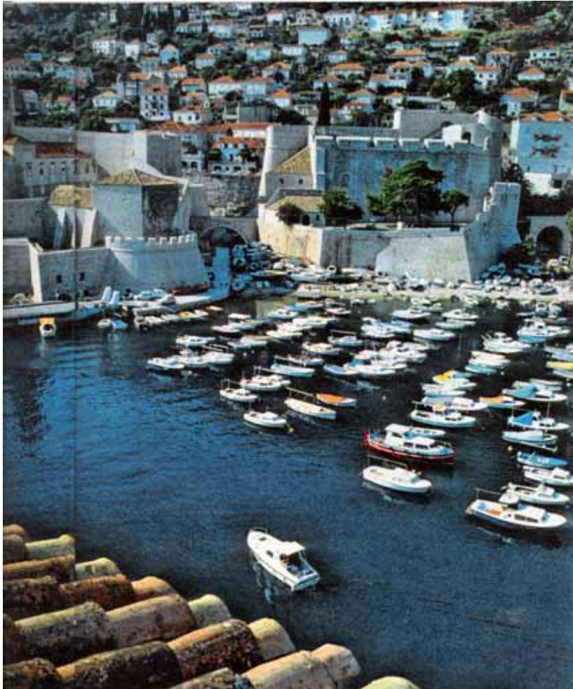
Dubrovnik costituisce un habitat molto particolare e un veritiero spirito del luogo.

della stratificazione”, che sopravvive ben oltre gli apporti omogeneizzanti della cultura internazionale. (U. Cardarelli, 1989). In ciascuna città del Mediterraneo possiamo riscontrare una eccezionale stratigrafia e ciò fa dar luogo alla visibilità delle permanenze che danno origine nella loro unitarietà al proprio genius loci ; in tutte il condizionamento della storia è molto forte in confronto con le città che hanno avuto la loro origine in differenti contesti, non dall’Antichità, ma dal Medioevo in poi. La città mediterranea assume una propria connotazione in ragione di un centro che ha subito rimaneggiamenti continui, sviluppi e crescita, addizioni e addensamento edilizio, non sempre pianificata, sopraelevazioni di piani abusive e una sovra-popolazione perenne, nell’urgenza spesso di catastrofi naturali etc... Ecco la ragione dell’esistenza di un carattere simile delle città del Mediterraneo e di problemi comuni: dai tessuti edilizi fortemente compatti e sovraffollati al traffico e alle difficoltà di circolazione e insufficienza di collegamenti, dalla mancanza di parcheggi e di pedonabilità, dai cambiamenti poco controllati ad un turismo di massa concentrato ai beni monumentali, dalla mancanza di spazi urbani pubblici liberi, non occupati da auto, alle nuove costruzioni abusive, presso i siti archeologici in contrasto con il paesaggio storico naturale e culturale ancora di grande pregio etc... Tutto questo