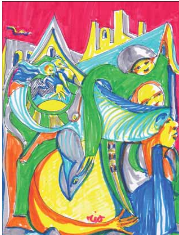
Come una fiaba