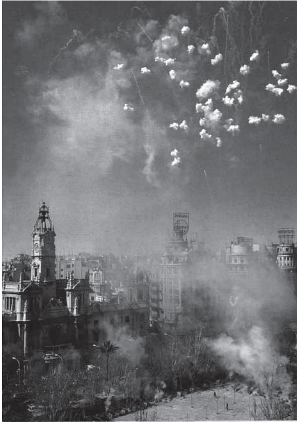
Valencia da Tout Valencia

città senza ricordare le città del Mediterraneo? Queste sono iscritte nella nostra memoria al punto tale che nessuna delle degradazioni che esse hanno subito può cancellare, né tanto meno imbarbarire» (P. Matvejevitch, 1999).