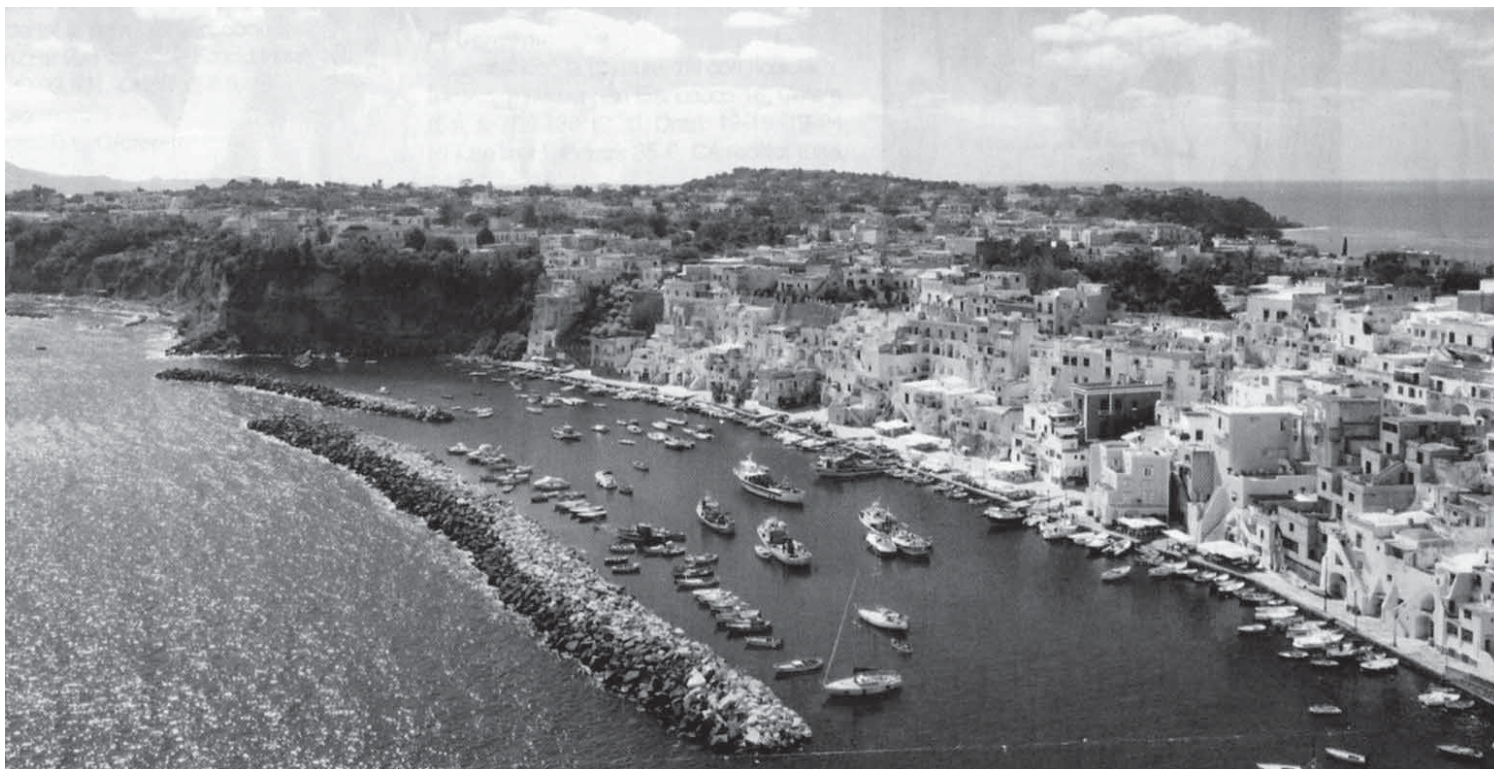
Procida, la Corricella dal mare

quotidiano, inseparabile dalla società dei paesi del Sud e dei territori che si affacciano sul Mediterraneo. Da cui consegue la necessità che si consideri la dimensione antropologica nella salvaguardia delle città storiche e del patrimonio ambientale (T. Colletta, 2008).