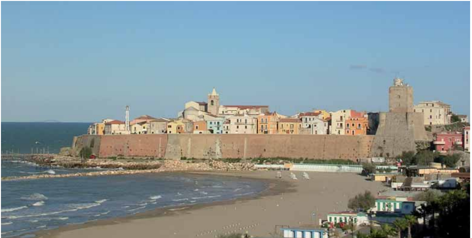
Termoli, il centro storico murato visto dal mare.

parrocchiali. La forte presenza delle architetture ecclesiastiche (cattedrali e campanili, chiese, parrocchie, santuari, monasteri, chiostri, moschee e minareti etc..) è la risultante di più secoli di vita cristiana e sei di vita musulmana che ha determinato un corpus di tradizioni delle comunità e del paesaggio monastico e religioso molto visibile nel panorama urbano nel quale si può riconoscere il genius loci dei luoghi mediterranei. La spiritualità e la religione, affermava il Braudel, è presente nelle popolazioni del Mediterraneo e in tutte le loro tradizioni (F. Braudel, 1949). La religione modella e conferisce un senso ai valori cittadini e al territorio urbano. Il forte spirito religioso, non solo personale, ma comunitario si ritrova nelle città come nei piccoli centri di tutto il Sud dell'Europa mediterranea: "l'altra Europa" nella denominazione operata dal Galasso.(G.Galasso,1982)