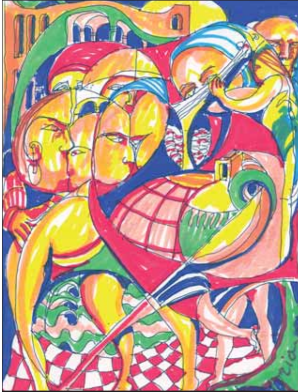
Area di festa