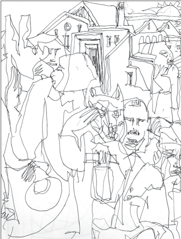
Giornata di sole