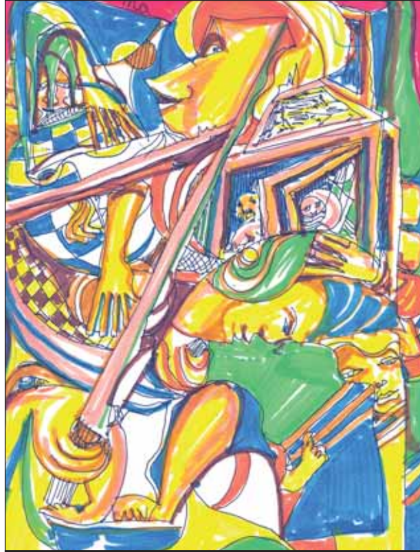
Lancia in resta