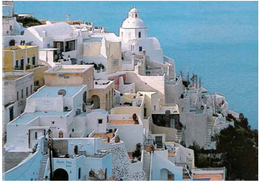
Isola greca. In viaggio con Platone

Lo spirito del luogo si nasconde nella densità della funzione collettiva: una commistione di funzioni mercantili, religiose e pubbliche e particolarmente nella estrema vitalità che si ritrova