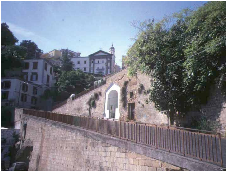
Napoli, Rampe di Sant'Antonio

Gli spazi aperti costituiscono il tessuto connettivo della città, luoghi di interazione tra l'uomo ed il paesaggio, spazi individuati come uno degli Alfabeti mediterranei (Forum su «Le città del Mediterraneo», 2002). Così la piazza: luogo pubblico per eccellenza (E. Guidoni, 1980) è una costante dell'urbanistica mediterranea, il vero centro della vita sociale, il cuore della città. La piazza dall' Agorà greca al Forum romano, per proseguire con le piazze sacrate alle piazze pubbliche e del mercato nel lungo Medioevo, alle Plazas mayor delle città spagnole,