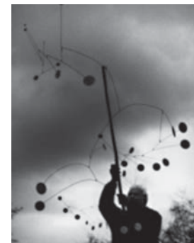
Ugo Mulas. Alexander Calder con Snow Flurry , Saché 1963 - ©Eredi Ugo Mulas

I rapidi spostamenti rappresentati dai flussi umani sul territorio urbano, così come i gesti e i comportamenti che scandiscono il moto dell'individuo nel proprio ambiente abitativo e lavorativo, disegnano traiettorie tridimensionali in ambiti spaziali statici o, quantomeno, soggetti a cicli temporali di trasformazione assai più ampi. Da qui la deduzione di Calder di accordare questi movimenti per arrivare ad una nuova possibilità di bellezza, ovvero di introdurre nell'ambiente antropizzato, artefatti inizialmente pensati come sistemi mobili, successivamente come forme statiche. Corpi in grado di compiere un'azione di mediazione tra l'energia vitale dei moti umani e la fissità dello spazio architettonico, armonizzando anche i ritmi e le evoluzioni naturali con gli ambienti progettati dall'uomo per accogliere ed assecondare al meglio la propria esistenza nel mondo.