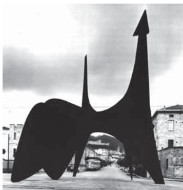
Teodelapio, Spoleto, 1962

Il Teodelapio - è questo il nome della scultura donata dall'artista alla città di Spoleto - è un'enorme struttura metallica in acciaio verniciato di nero, realizzata su grande scala con metodi industriali e pesantemente ancorata al suolo. Essa si erge, senza basamento, direttamente sul piazzale della stazione ferroviaria, come un monumentale elemento architettonico in grado di esaltare le proporzioni moderate della città medievale e di metterne in rapporto dialettico le diverse componenti. Un oggetto dotato di straordinario dinamismo, capace di ravvivare lo spazio intorno a sé e di giocare con lo sguardo del passante, disorientandolo con l'alternanza delle visuali prospettiche e scalandolo vertiginosamente in alto lungo le sue linee sinuose. Realizzato in occasione del Festival dei Due Mondi del 1962, per la mostra Sculture nella città ideata e curata da G. Carandente, fu definito da quest'ultimo «la sola grande e importante scultura del XX secolo su una piazza italiana o, per essere più precisi, la sola scultura di convinta modernità eretta fino a quel 1962 per una pubblica piazza del nostro Paese, fino ad allora ricco soltanto di pomposi monumenti celebrativi dell'Ottocento» 11 .