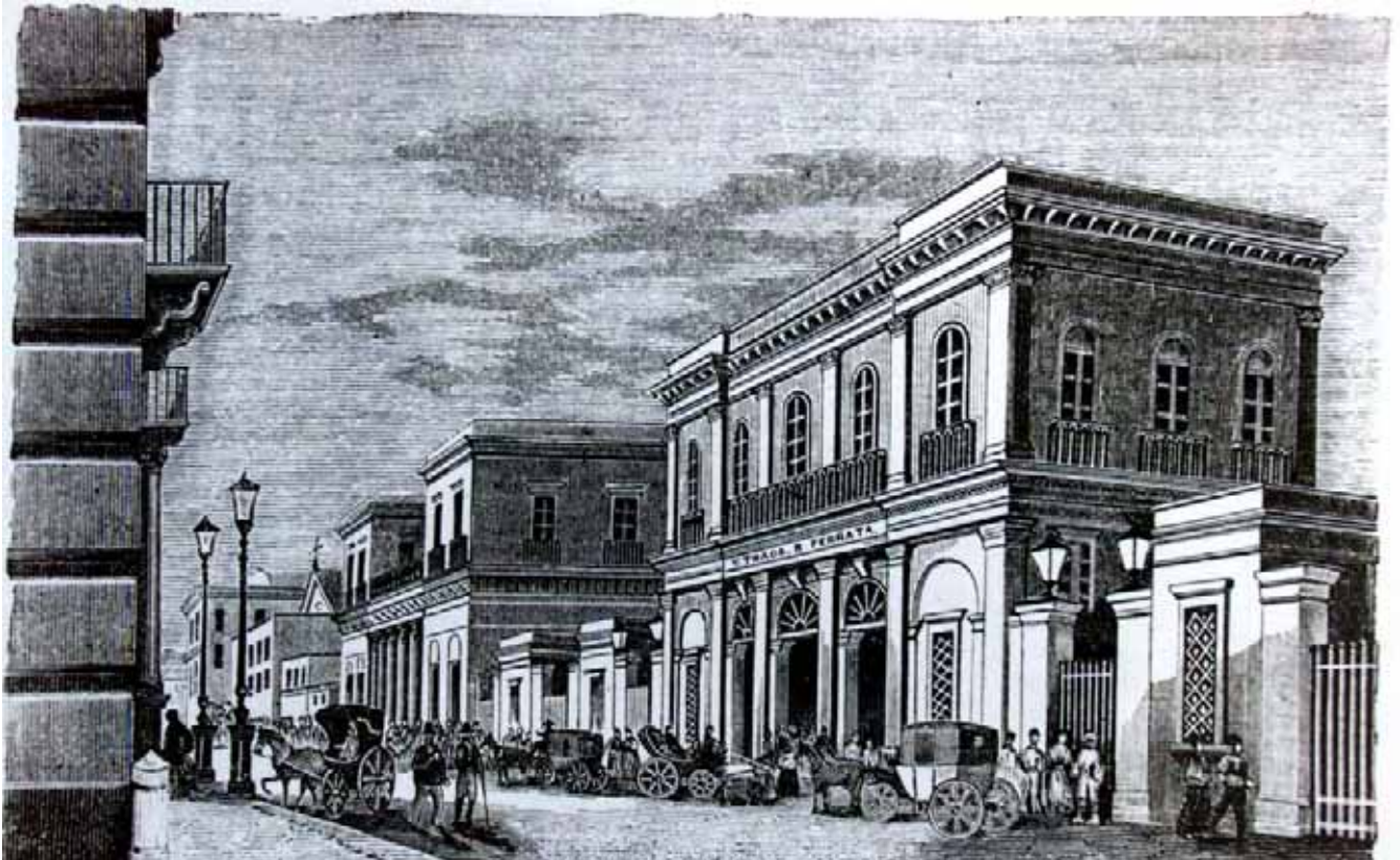
Le stazioni ferroviarie sul corso Garibaldi (già via dei Fossi) delle linee Napoli-Portici (1839) e Napoli-Caserta (1842). Litografia, (dis.) Capozzi, (inc.) Lucioni, pubblicata e tratta da A. Buccaro "Istituzioni e trasformazioni urbane nella Napoli dell'Ottocento", 1985.

Per completare un quadro più che variegato, multiforme, aperto e definibile come "globalizzato" ante litteram occorre aggiungere anche altri caratteri ed elementi dell' "eclettico" mondo ottocentesco, che affonda le sue radici nell'Illuminismo e ne eredita alcuni caratteri prevalenti: esotismo, "grandi viaggi", manualistica e relativa ampia diffusione editoriale, tema del "giardino" e della "città", sperimentazioni tecnologiche e nuovi caratteri costruttivi. Così come allo stesso tempo trovano sviluppo aspetti del tutto nuovi derivanti anche dalle scoperte scientifiche e dall'innovazione tecnologica che comportano l'adozione di nuovi materiali nelle costruzioni con la conseguente diffusione dei tracciati ferroviari sul territorio insieme alla sperimentazione di nuovi linguaggi artistici e ai tentativi di pianificazione per lo sviluppo della città.