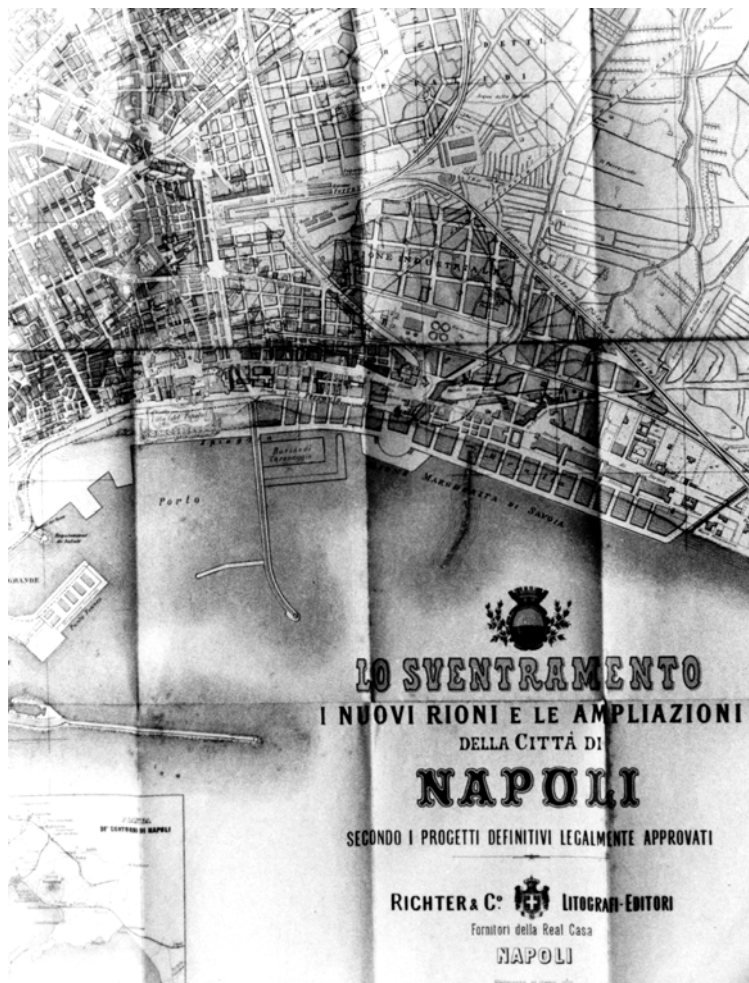
“Lo sventramento i nuovi rioni e le ampliamenti della Città di Napoli secondo i progetti definitivi legalmente approvati” (mappa a stampa turistica, pieghevole); dettaglio dell’area orientale. Richter & C°. Litografi-Editori, primo quarto del Novecento. Napoli, Archivio Storico Diocesano.

fia Richter & C. che aveva sede e punto vendita presso i portici della chiesa di San Francesco di Paola in piazza Plebiscito. Oltre al Piano del Rione Industriale, che conferma le ipotesi di sviluppo borbonico, è indicato il Rione Margherita, una sequenza di blocchi edilizi posizionati lungo la linea di costa in un’area compresa tra il bacino di carenaggio orientale e i Granili (la struttura progettata da Ferdinando Fuga nel 1779 e purtroppo demolita dopo la seconda guerra mondiale).