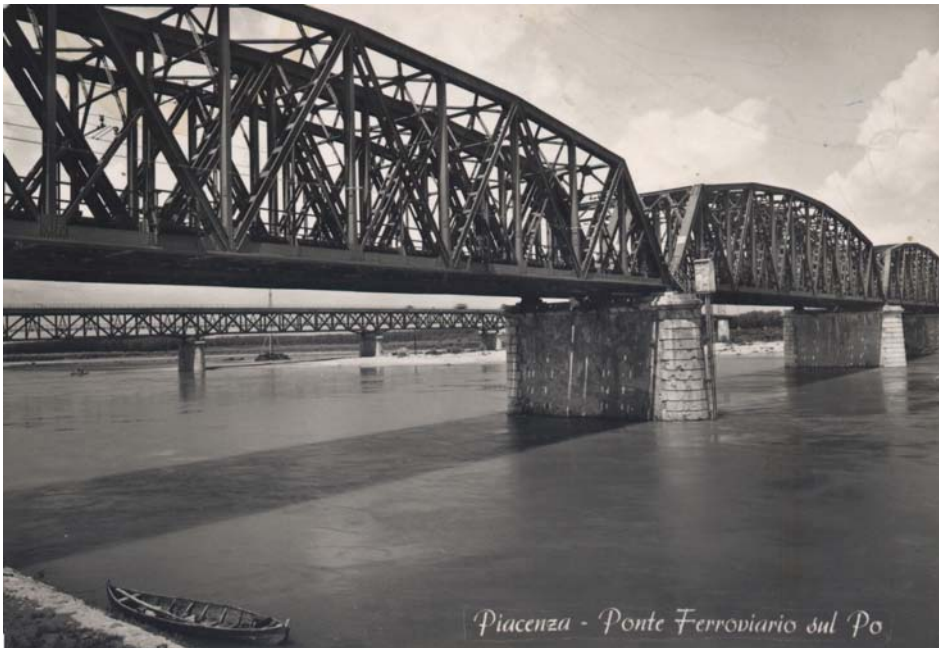
Piacenza - Ponte Ferroviario sul Po

Ponte sul fiume Po a Piacenza, nella ferrovia Milano Bologna. Ponti e gallerie rappresentarono nell'Ottocento e nel primo Novecento le maggiori creazioni della tecnica. Nelle gallerie l'Italia raggiunse il primato mondiale per lunghezza degli scavi.