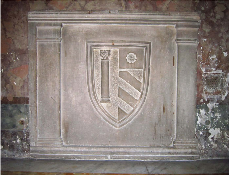
Fig. 5. Stemma Colonna partito Orsini conservato nella cappella dei Colonna a San Silvestro in Capite.