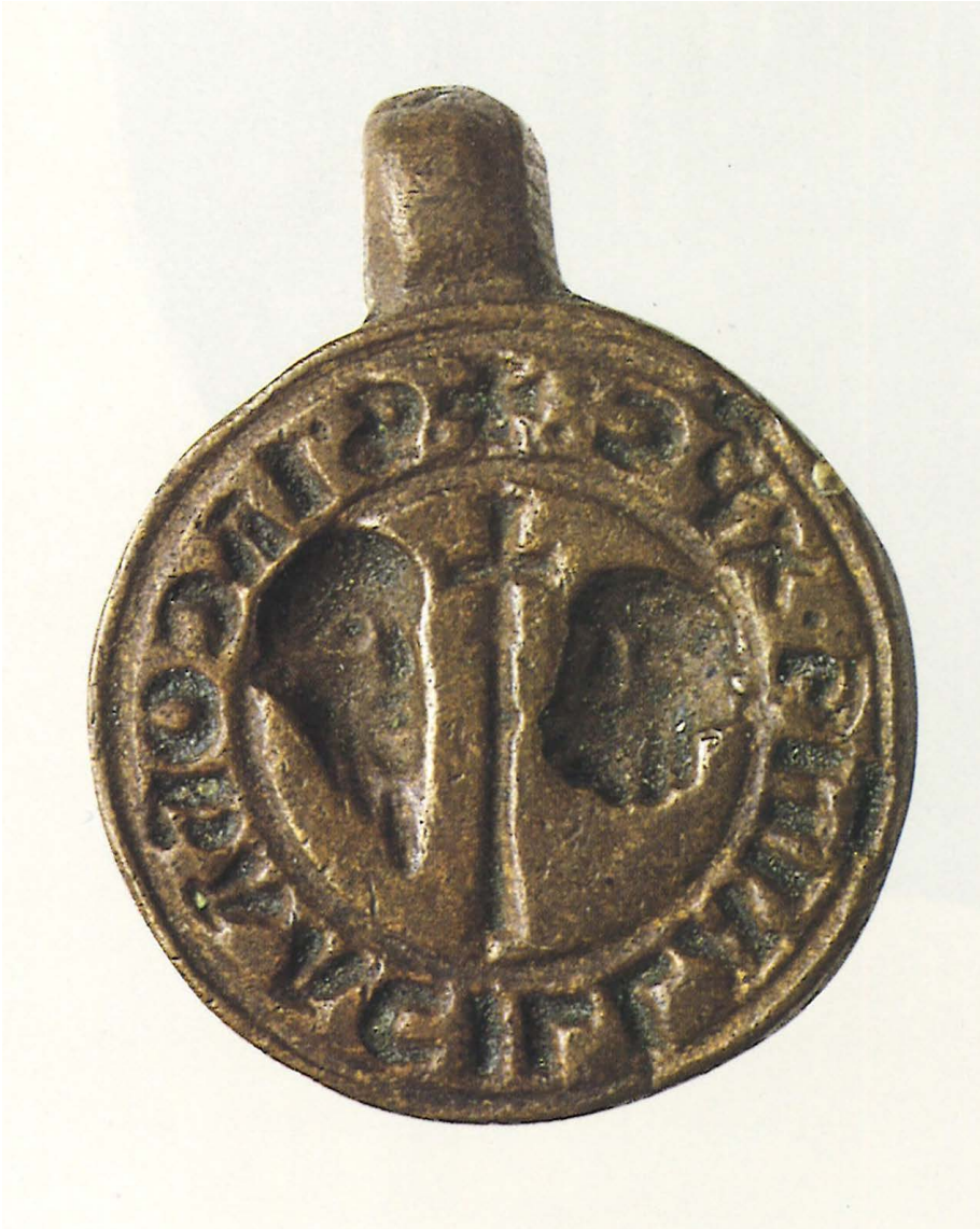
Fig. 1. Sigillo di Jacopa Normanni in Frangipane detta dei Sette Soli: S(igillum) Iacoba a[n]cilla Ie(su)s Chr(i)s(t)i , Roma, Museo di Palazzo Venezia, Collezione Corvisieri ( La Collezione Corvisieri Romana , a cura di C. Benocci, Roma 1998, p. 62, n. 51).