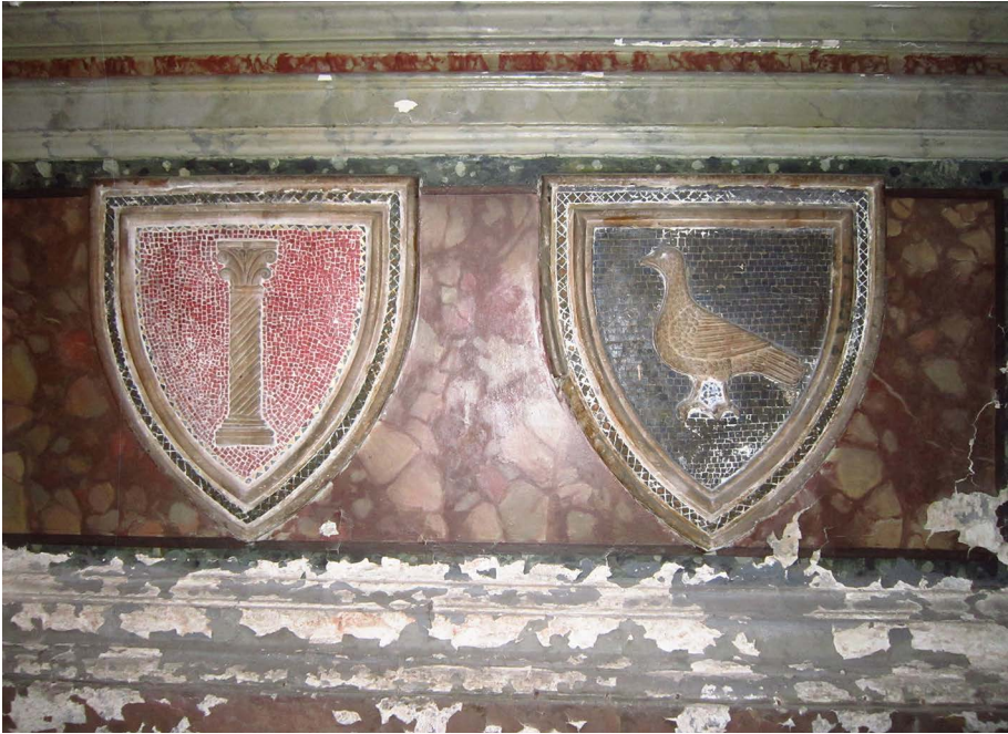
Fig. 3. Stemmi dei Colonna e dei Palombara conservati nella cappella dei Palombara a San Silvestro in Capite.