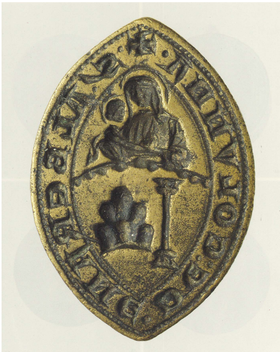
Fig. 2. Sigillo di Alberana Montenero: S(igillum) Alberane de Colunna , Roma, Museo di Palazzo Venezia, Collezione Corvisieri ( La Collezione Corvisieri Romana , a cura di C. Benocci, Roma 1998, p. 59, n. 46).