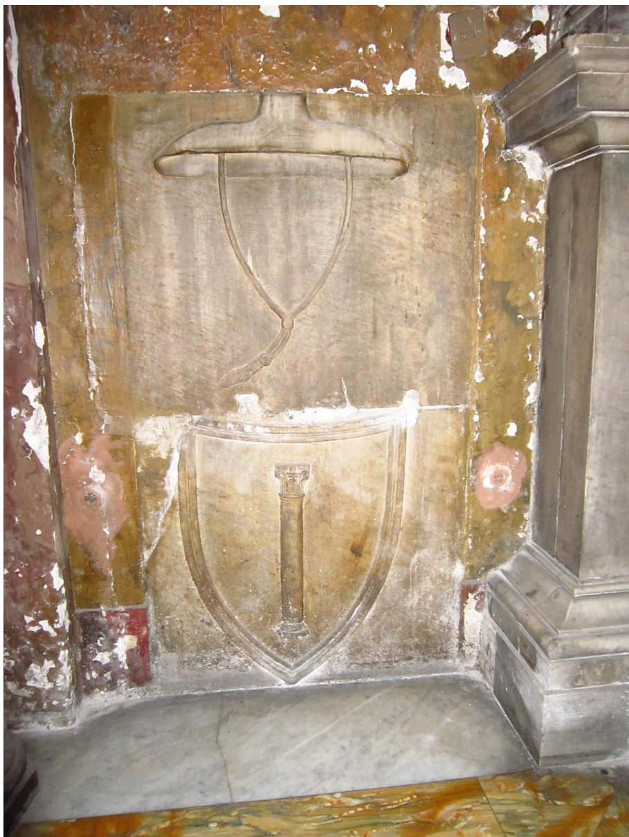
Fig. 4. Stemma di un prelato Colonna (del cardinale Jacopo Colonna?) conservato nella cappella dei Colonna a San Silvestro in Capite.