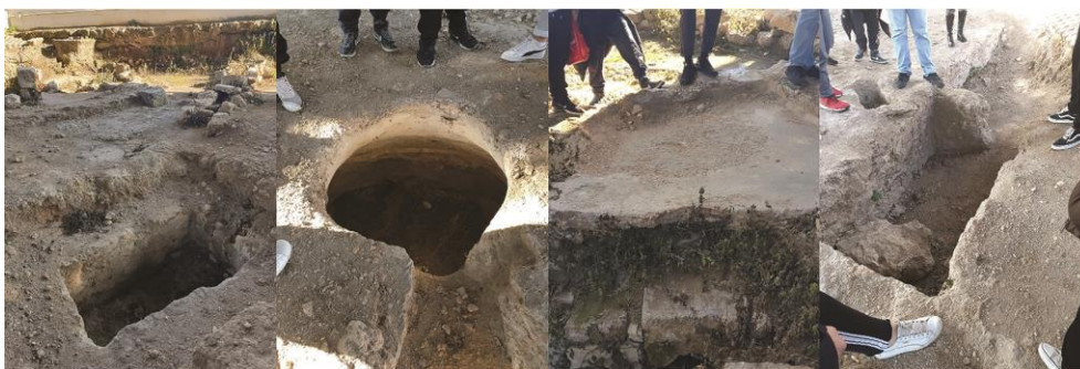
Fig. 5 - Archeo inciampi