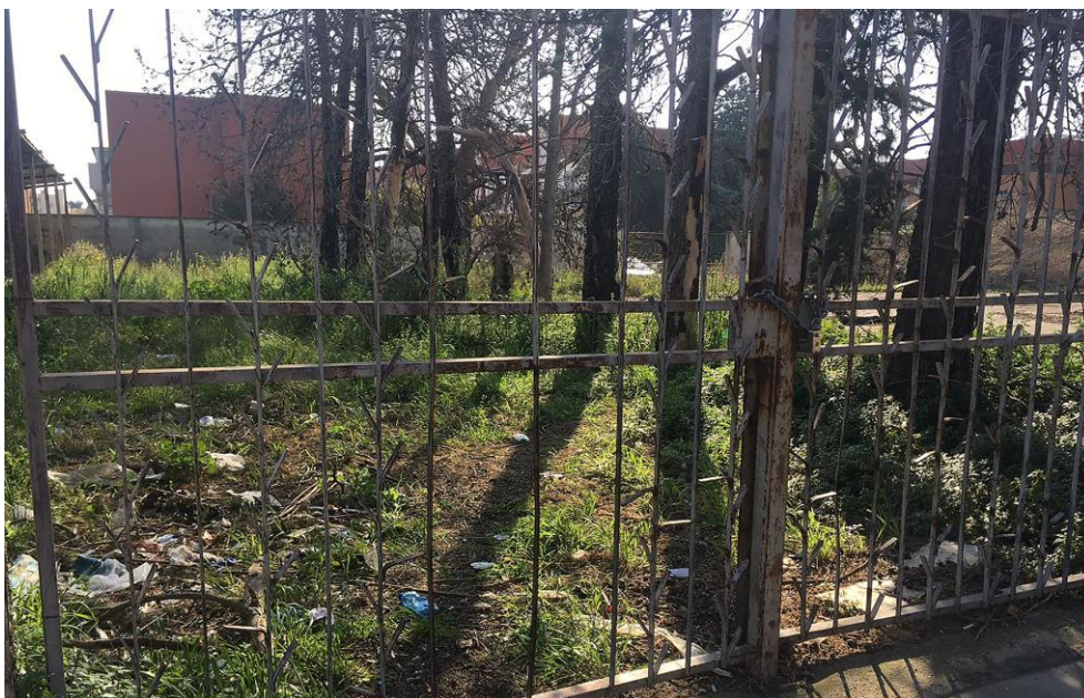
Fig. 4 – Il campo sportivo