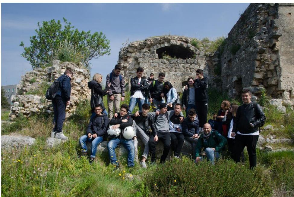
Fig. 3 – I partecipanti al Photovoice durante l'esplorazione alla Torre Don Ciccio

anziché sviluppare in modo autonomo e personale il tema fotografico, hanno selezionato e condiviso con gli altri le fotografie scattate durante le esplorazioni urbane. Queste ultime hanno sostanzialmente permesso ai soggetti meno volenterosi di restituire in modo sbrigativo e semplicistico l'esperienza dei propri paesaggi quotidiani.